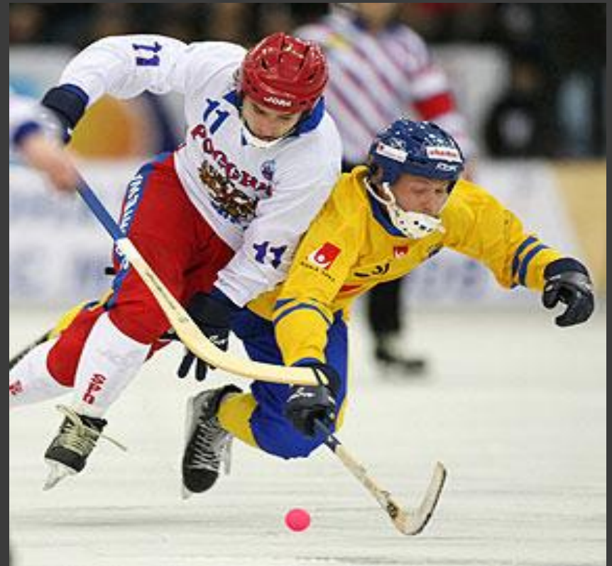
Хоккей с мячом