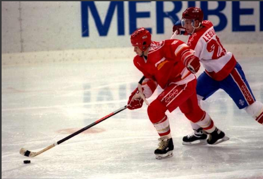
Хоккей с шайбой

Он играет на коньках. Клюшку держит он в руках. Шайбу этой клюшкой бьёт. Кто спортсмена назовёт? (Хоккеист)